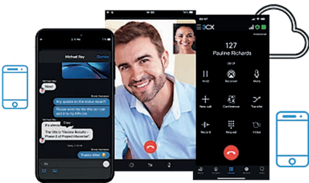
Mobile Apps integrieren sich nahtlos

Die Cloud Telefonanlage bündelt alle Anschlüsse über Datenverbindungen: so können Sie in einer Anwendung von Festnetz- und Mobiltelefonie über Webmeetings bis hin zur Call-Center-Funktionalität nutzen.