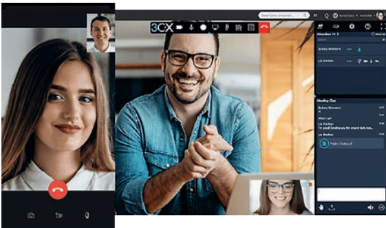
Videokonferenzen sind mit unterschiedlichen Endgeräten möglich

Ob Festnetztelefon, Smartphone oder Webbrowser – die flexible, aber einheitliche Kommunikation und Zusammenarbeit erleichtert für Ihre Mitarbeiter Videokonferenzen, Austausch und Abstimmungen – egal wo diese gerade arbeiten.