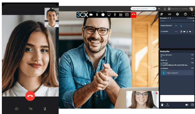
Videokonferenzen sind mit unterschiedlichen Endgeräten möglich

Ob Festnetztelefon, Handy oder Webbrowser – die flexible, aber einheitliche Kommunikation und Zusammenarbeit erleichtert für ihre Mitarbeiter Videokonferenzen, Austausch und Abstimmungen – egal wo diese gerade arbeiten.