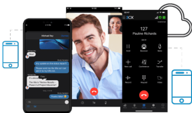
Mobile Apps integrieren sich nahtlos

Die Cloud Telefonanlage bündelt alle Anschlüsse über Datenverbindungen: so können Sie in einer Anwendung von Festnetz- und Mobiltelefonie über Webmeetings bis hin zur Call-Center-Funktionalität nutzen.