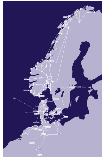
Abbildung 2: GlobalConnect verfügt über ein firmeneigenes Glasfasernetz in Deutschland, Dänemark, Norwegen und Schweden.